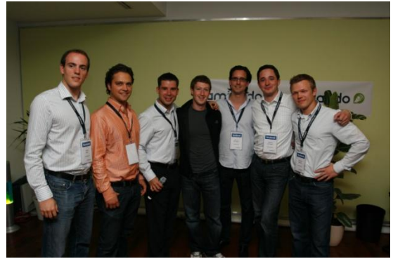
Mark Zuckerberg, el fundador de Facebook visita amiando en su oficina de Múnich